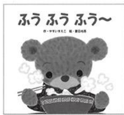
作/やすいすえこ 絵/夏目尚吾 ひさかたチャイルド