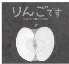
作/川端誠 文化出版局